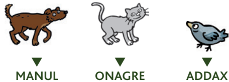
▼ MANUL ▼ ONAGRE ▼ ADDAX

2 Continuez en direction de la fontaine et observez la façade que vous indique, de ses deux doigts, le personnage au centre de la fontaine. Observez bien l'enseigne. Quatre personnages portent des plats. Quel animal les suit ? L'indice n° 2 est le mot inscrit sous le dessin lui correspondant.